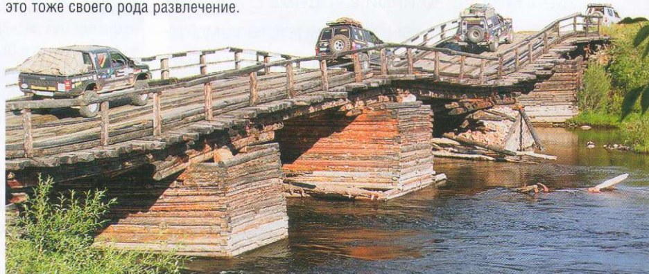
На пути домой по Удунгинскому тракту через Байкальский хребет.

P.S. Халхин-Гол. Здесь, у берегов легендарной реки, самая восточная точка Дороги Тысячелетия. Но путешествие не закончено. Наш путь лежит на юго-запад, в Восточную и Центральную Гоби, далее поворачиваем на север и вновь пересекаем Монголию, на этот раз по дороге домой... ORD