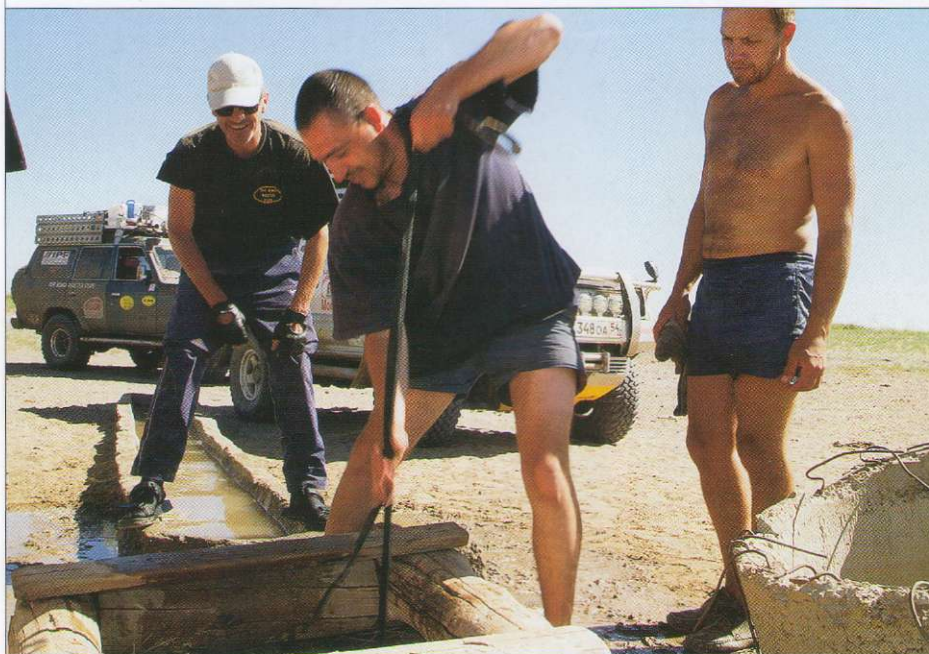
Вода в пустыне – это источник жизни. А значит, все дороги здесь идут от колодца к колодцу.