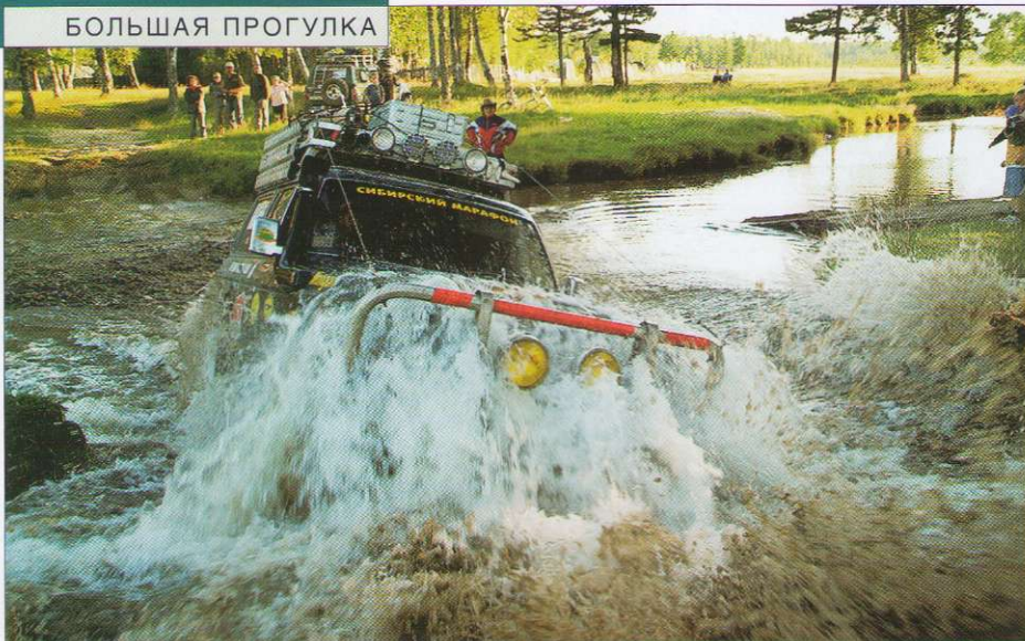
Монголия – страна, не слишком богатая водными ресурсами. В общем, мы старались не упускать возможности ополоснуть наши измученные солнцем и пылью машины.

тельного: в Монголии ульяновский внедорожник – самый что ни на есть культовый автомобиль. Обступив российские «джипы» плотным кольцом, они громко обсуждают их и цокают языками. Каждый считает своим долгом не просто потрогать машину, заглянуть под днище и со знанием дела попинать колеса, они так и норовят без спроса залезть в кабину. Более того, некоторые, судя по всему, уже готовы начать «разборку на сувениры»! Как можно быстрее отправляемся в путь. Но в следующем поселке история в точности повторяется!