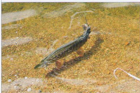
Рыбалка в Монголии просто фантастическая. Даже новичок легко натаскает метровых трофеев.