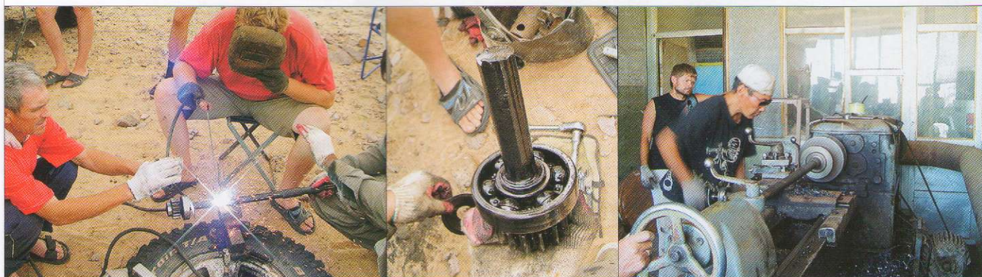
Слово «ремонт» на монгольском звучит как «заставар». Так вот, от недостатка «заставаров» экспедиция не страдала. Порванные полуоси, тяги, оторванные амортизаторы, лопнувшие рессоры, согнутые балки и развалившийся чулок моста. Походный набор – автомобильный сварочный аппарат, дрель, болгарка, преобразователь на 220V. А вот токарный станок в багажнике не уместился. Пришлось обращаться за помощью...