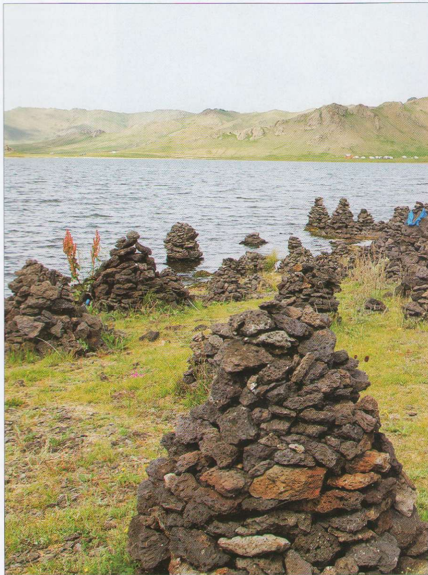
Священное место на Белом Озере. Ритуальные пирамидки выложены из вулканических по

Кстати, в ходе путешествия по Монголии участникам «Сибирского Марафона» пришлось преодолеть и горы, и степи, и пустыни. Так, на западе страны преградой были перевалы Монгольского Алтая. Для тягелов грузных машин это оказалось непростым испытанием. Тут были и перегревы двигателей на подъемах, и предельные нагрузки на тормозную систему в ходе спусков. Недолгие стоянки на вершинах г