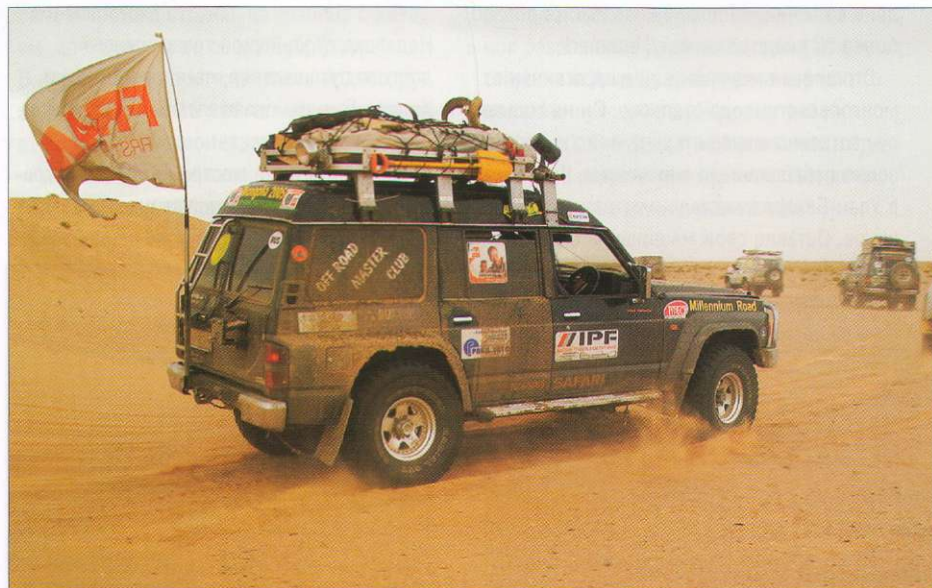
Плюс 48 градусов в тени. Жарко! Даже вездесущая пыль не заставит экипаж закрыть окна.

Было еще одно удивительное сооружение, которое мы не могли не посетить. Я говорю о «гэр», или монгольской юрте. На своем пути мы встречали множество белых куполов (лето, и кочевники выгоняют свой скот на пастбища). Гостям обитатели юрт рады. Угощают чаем и домашним сыром. Неизменный уклад жизни сохраняется в Монголии на протяжении сотен, а может, и тысяч лет. Соответственно, и внутреннее пространство юрт хранит традиции вековой давности. Все скромно. Несколько кроватей, комод и сундук. В середине юрты печка, которую топят аргалом – высушенными навозными лепешками. Рядом высокие технологии – цветной телевизор и DVD-проигрыватель. На «дворе» спутниковая антенна. А питается это «электронное хозяйство» от солнечных батарей!