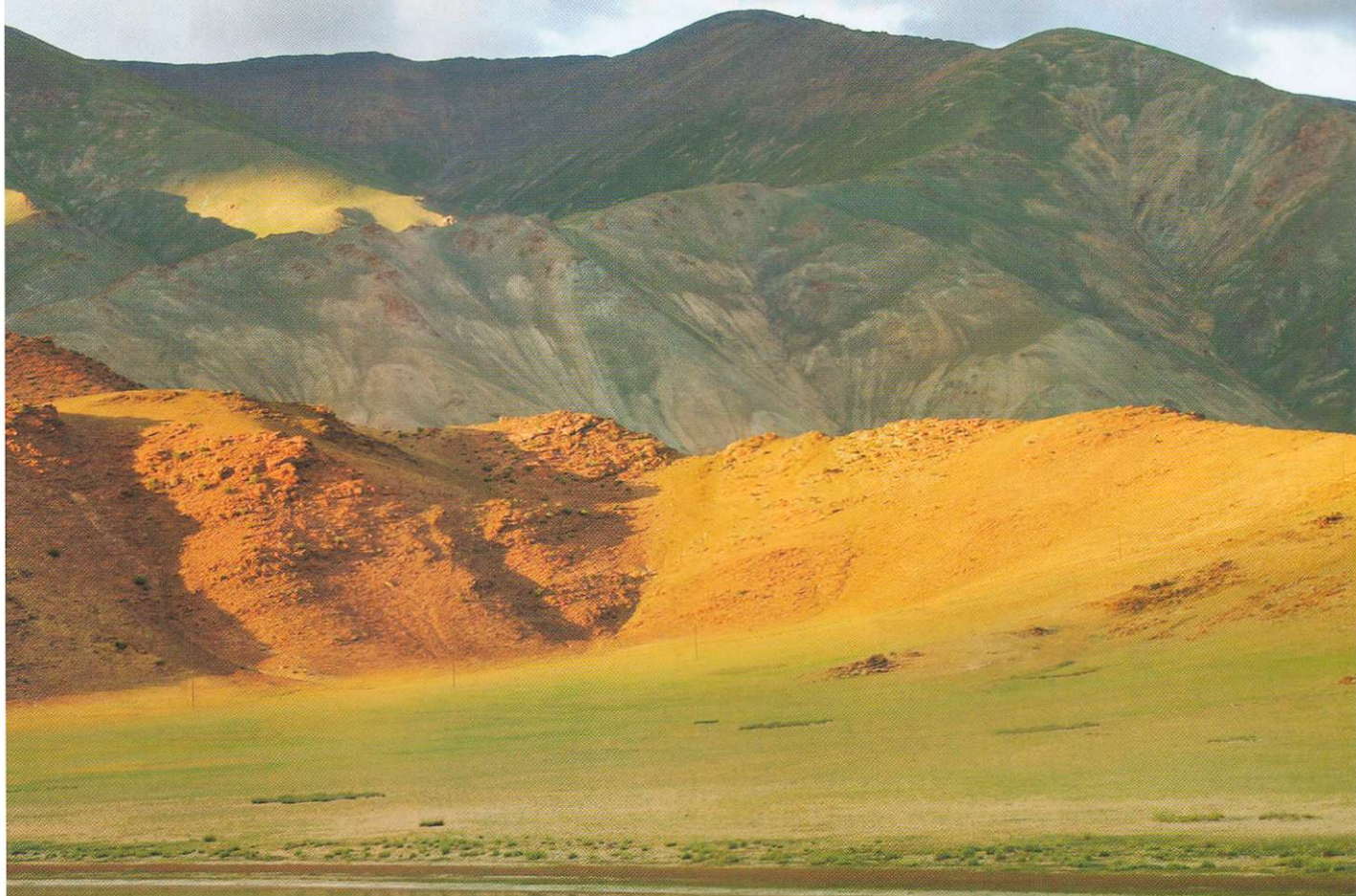
Совершенно удивительная в своей первозданной красоте, природа Монголии манит возвращаться сюда еще и еще...

хопутное государство и расположена на самом востоке страны, на границе с Китаем, проходящей по озеру Буйр-Нуур. В итоге, общая протяженность водных рубежей государства монгольского составляет порядка 30 километров. А поскольку «Озерные пограничники» звучит и по монгольски не совсем красиво, то пограничная застава на озере называется «Морская». «Монгольские моряки» очень гордятся своей эксклюзивной службой и не без хвастовства щеголяют нарядными пограничными значками, на которых изображен якорь!