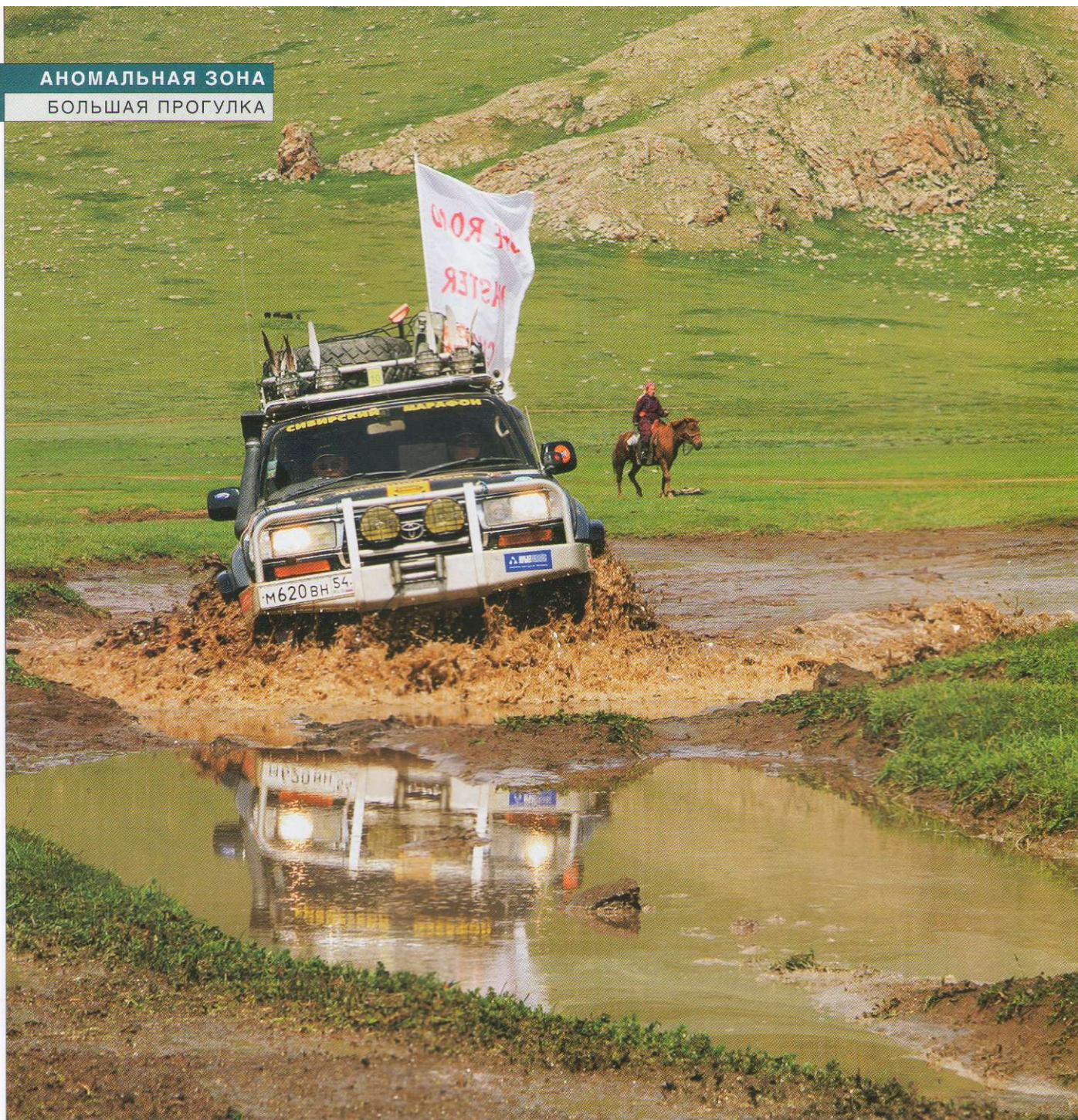
Через какие-то 10 лет здесь будет относительно гладкий асфальт Millenium Road. Ну а сейчас это лишь тысячи километров бездорожья.