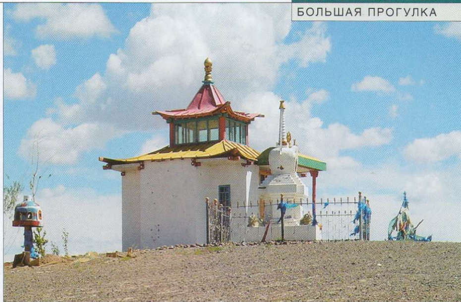
Монголия – территория развитого тибетского буддизма. Эта религия начала распространяться здесь в XIII веке еще при внуке Чингисхана Хубилае. Неудивительно, что действующие буддийские храмы и монастыри сегодня разбросаны по всему «степному» государству.

ревалов, украшенных ритуальными «сооружениями» – «Обо», местами поклонения богам, духам перевалов. Любопытный момент: считается, что каждый, преодолевший перевал, обязан отблагодарить духов. А как известно, с ними шутить не нужно – обидевшись, они будут мешать путнику туманом, снегом, а то и чего хуже – камнепадом. Радует одно – монгольские духи не капризны и могут принять в дар все, что не жалко путнику – монетки, различные безделушки и самый обычный... камень (собранные за много лет «сооружения» сегодня похожи на пирамиды). Есть и альтернативный вариант – можно просто выпить за здоровье духа. Похоже, он устраивает обе стороны. По крайней мере, пирамиды из пустых бутылок размерами уже начали