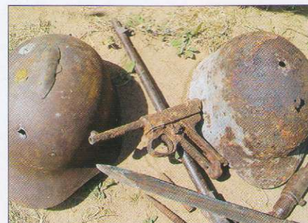
Страшное эхо войны. На Халхин-Голе подобные «сувениры» нам предлагали по $8.

Недалеко от конечной точки нашего долгого путешествия, легендарной реки Халхин-Гол, мы оказываемся еще в одном, мягко говоря, уникальном по меркам степной Монголии месте – Морской пограничной части! Она единственная на все су-