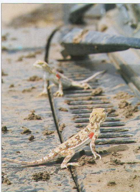
Любознательные жители пустыни. Кургут – очень жизнерадостная и юркая гобийская ящерица.